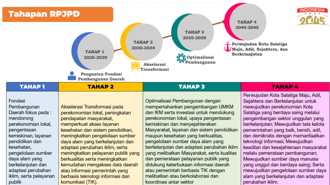
Gambar 2-6 Tahapan RPJPD Tahun 2025-2045

Sumber: Bappeda Kota Salatiga, 2024, https://bappeda.salatiga.go.id/rpjpd2045/