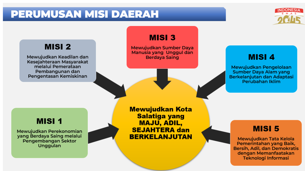
Gambar 2-5 Misi Kota Salatiga 2025-2045

Sumber: Bappeda Kota Salatiga, 2024, https://bappeda.salatiga.go.id/rpjd2045/