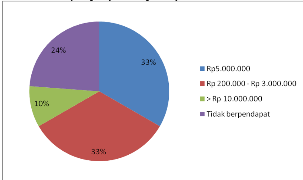
Gambar 1. Pendapat Konsumen Mengenai Besaran Omset Pengusaha yang Wajib Pungut Pajak Restoran

Meskipun demikian sebanyak 48% konsumen keliru mempersepsikan pajak restoran sebagai pajak yang ditanggung oleh pengusaha restoran.